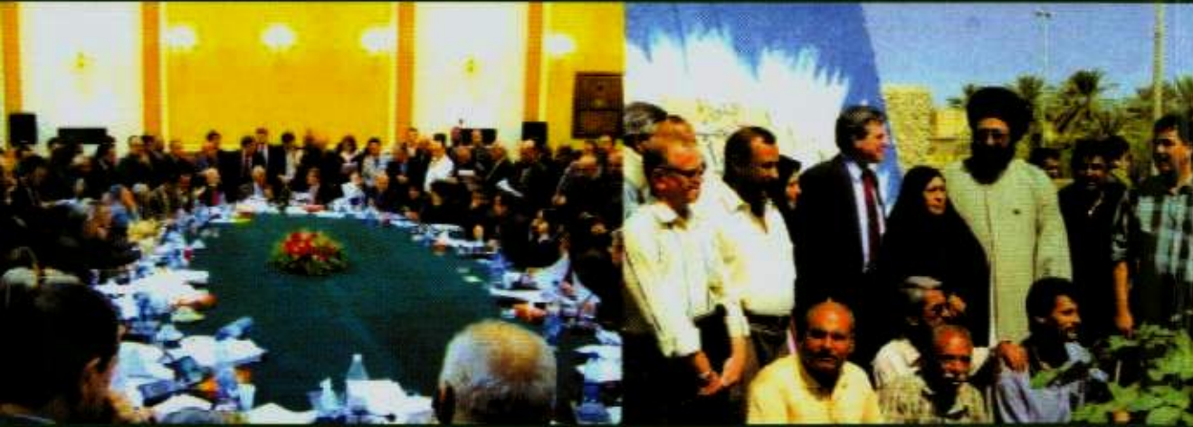
عند تصب ضحايا صدام في الحلة